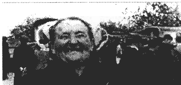
Colloque à l'I.N.J.E.P. Marly-le-Roi du 28 au 31 mai 1990