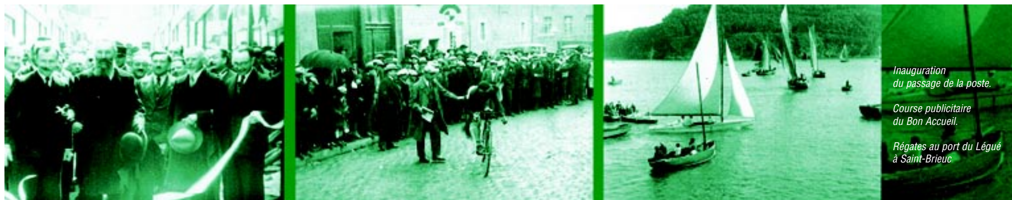
Inauguration du passage de la poste.