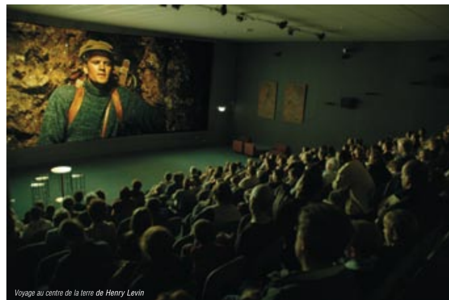
Voyage au centre de la terre de Henry Levin

Océanopolis Brest [www. Oceanopolis.com] présentait du 22 octobre au 2 novembre 2005 le Festival du film de l'Aventure Océanographique.