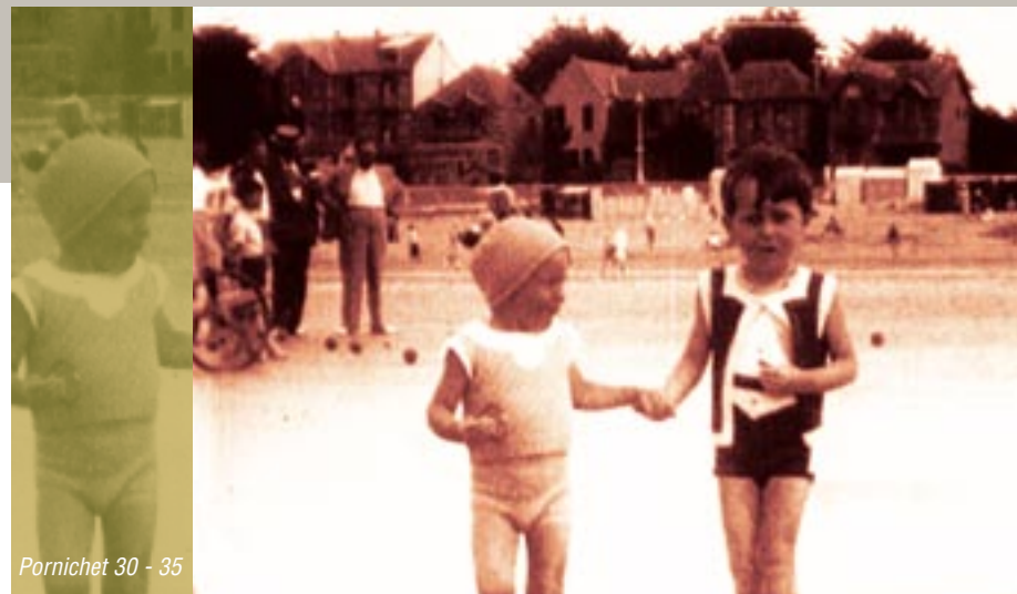
Pornichet 30 - 35