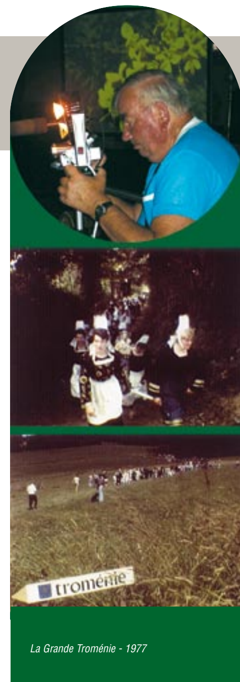
La Grande Troménie - 1977