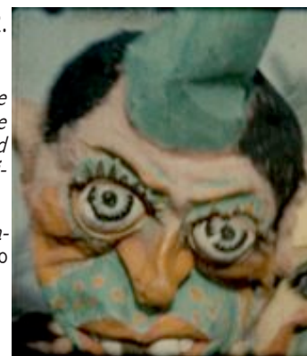
Photo extraite du film : Carnaval de Brest de François-Xavier Mahé - Cinémathèque de Bretagne

Exposition : MJC/MPT Harteloire - 39, avenue Clemenceau - Brest (29) - En savoir plus : www.festivalpluedimages.com