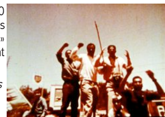
Un Peuple en Marche (R. Vautier)

Diffusion le 10 septembre 00h15 dans la case de l'Oncle Doc sur France 3 National, puis le 15 septembre à 16h30 sur France 3 Alsace.