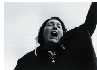
Femme de marin

Le chagrin d'une femme de marin, qui après avoir perdu son mari, péri en mer, puis l'aîné de ses fils, voit le plus jeune s'embarquer clandestinement sur un cargo.