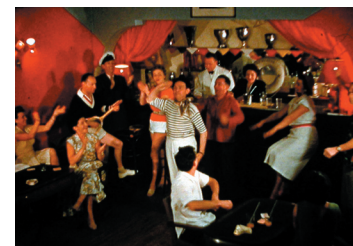
Le Mariage de Fanchette

Entrée libre - Archives Départementales de Loire-Atlantique - 6, rue de Bouillé - 44000 Nantes