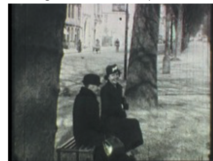
Où sommes-nous ? – Emmanuel Debroise