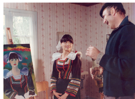
Les Galettes de Pont-Aven

(*Étudiants, demandeurs d'emploi et adhérents Cinémathèque)